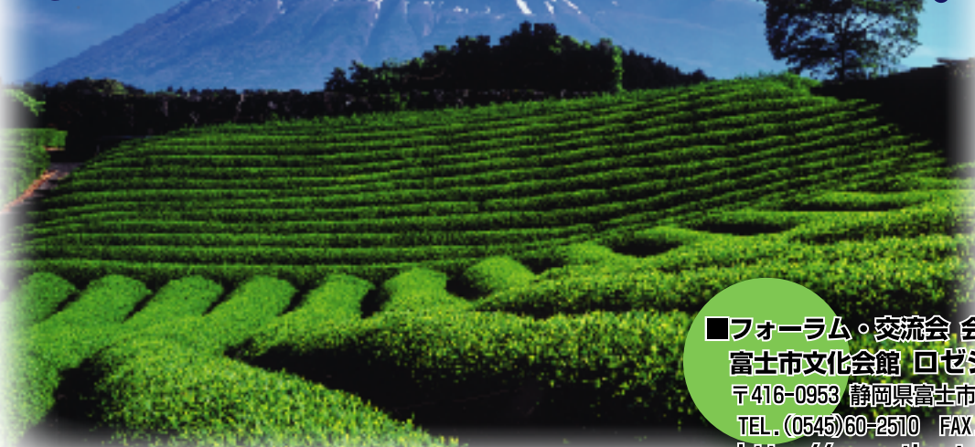
第1回 富士山百景写真コンテスト 金賞受賞