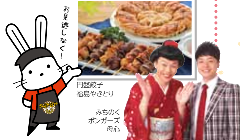
お見逃しなく！ 円盤餃子 福島やきとり みちのくボンガーズ 母心

18:00～ 交流会 まちなか広場で全国まちの駅のみなさんと楽しく交流しましょう！