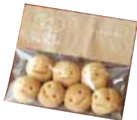
▲被災地(被災者)で作られるにこまるクッキー

2011年1月に、自身が行っている農業支援活動団体「チームむかご」を社団法人化し、同法人の代表理事を勤める。2011年3月11日の東日本大震災の後は被災地支援の活動(にこまるプロジェクト)も同法人で行っている。