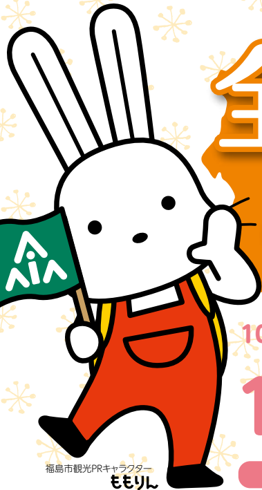
福島市観光PRキャラクター ももりし