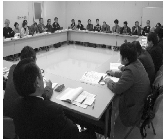
各分科会で熱い議論が交わされました