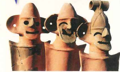
全国でも珍しい、前の山古墳出土「笑う盾持人埴輪」(本庄市指定文化財)