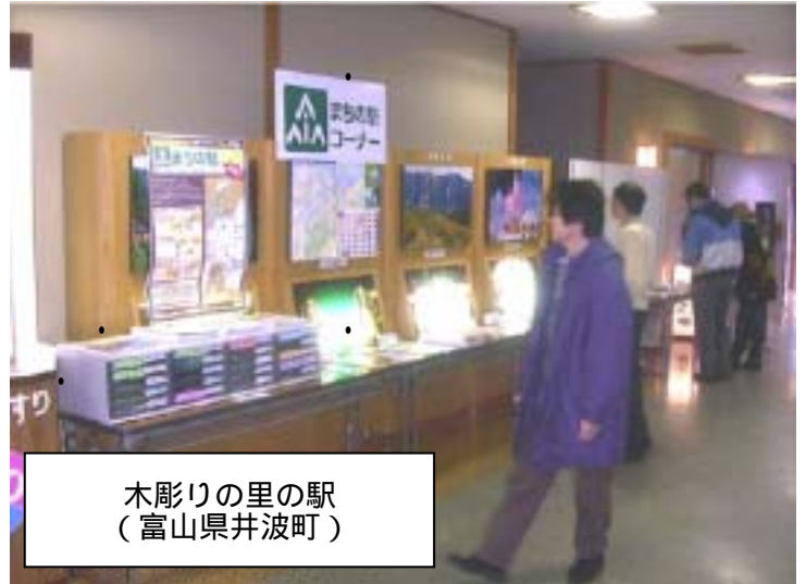
木彫りの里の駅 (富山県井波町)